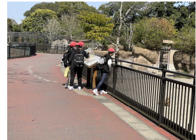
【動物園でリラックス】