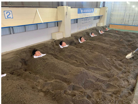
【指宿砂蒸し温泉でデトックス】