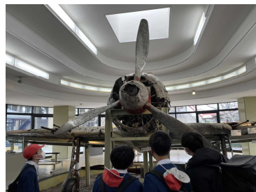
【知覧特攻平和会館】