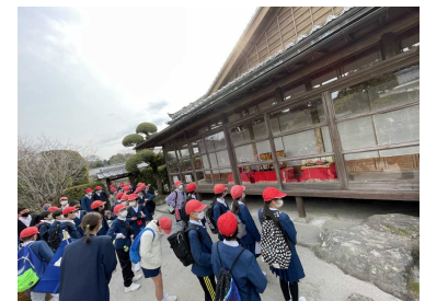
【知覧武家屋敷群の見学】