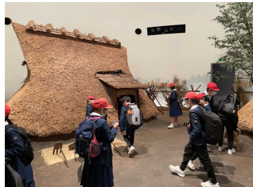
【ココはしむれ歴史探訪】