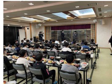
【夕食はホテルの懐石料理】