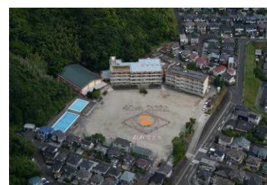
(40周年記念航空写真)