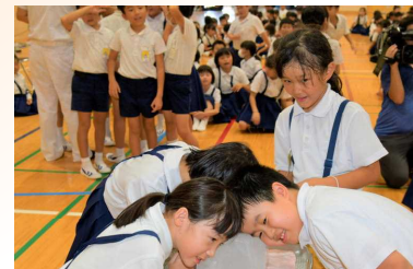
「氷が解ける音を聞く」