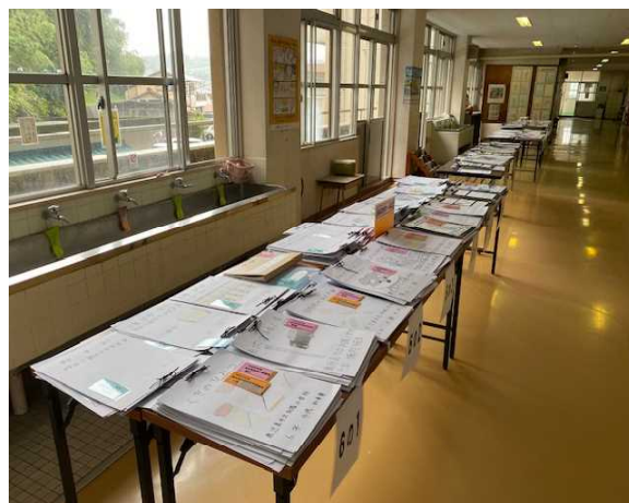
▲力作が並ぶ自由研究の作品

今、職員室前には、子供たちの夏休みの自由研究が展示されています。ユニークな研究内容もたくさんあり、興味深く読ませてもらいました。いくつか紹介しますと、「なぜ昼と夜があるのか」「家の