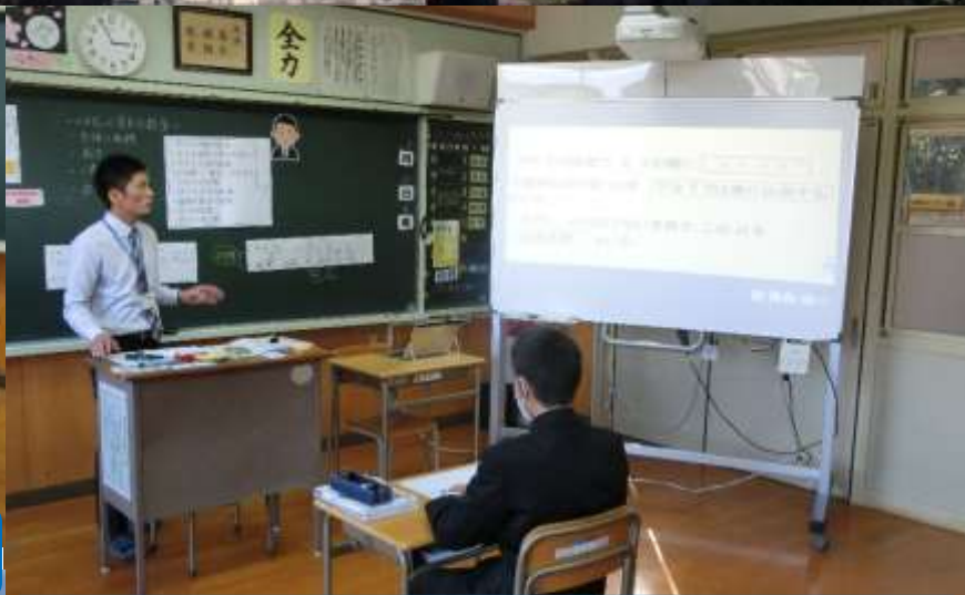
個別支援計画、定着度に応じた、きめ細かな授業