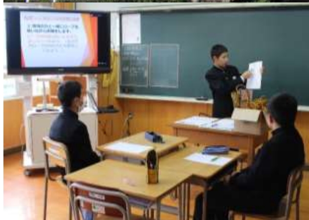
桜島と共に生き、主体的に学ぶ防災教育