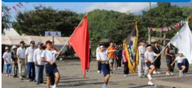
小・中・地域が一体となった教育活動