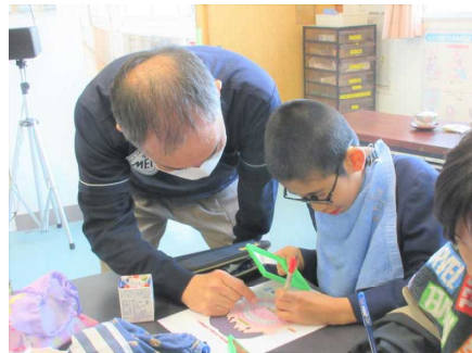
いい歯ニッコリ かごしま週間

8020(はちまるに一まる運動:80歳時に自分の歯が20本ある)ことができるように、継続して歯磨きに取り組んでほしいものです。