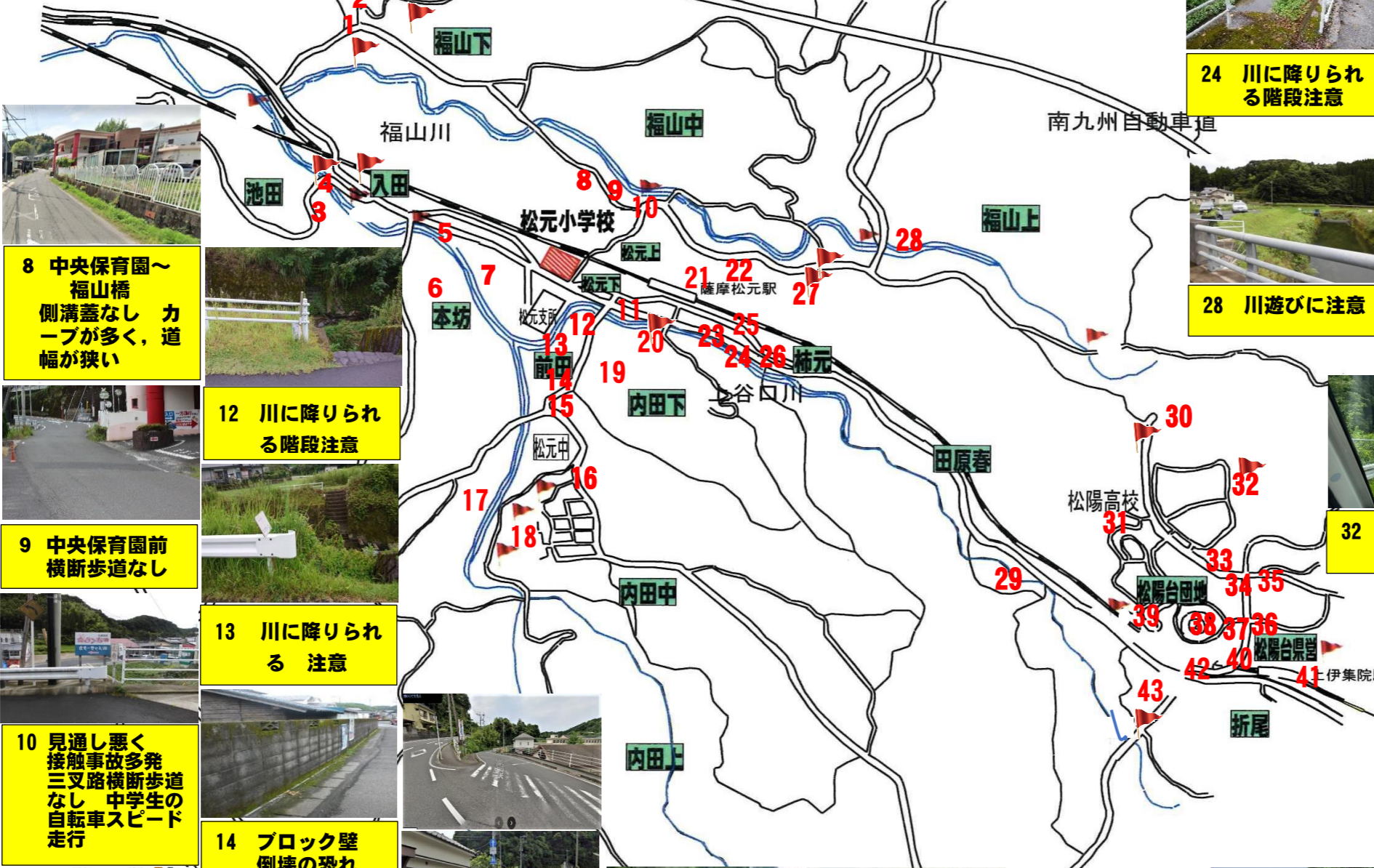
8 中央保育園～ 福山橋 側溝蓋なし カーブが多く、道幅が狭い