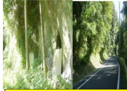
1 防空壕あり 崖あり側溝大