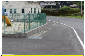
3 上谷口公園 スピードを上げて走る車が多い