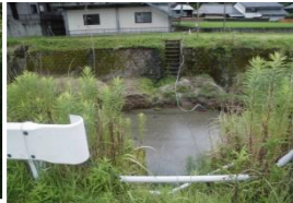
7 川に降りられる 注意