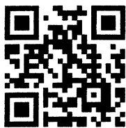
南中ホームページ