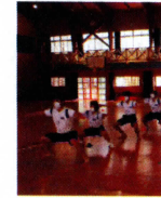
【声を出さない練習】

日程 生徒は通常登校(給食有) 8時40分～8時50分 開会式 9時00分～12時15分 競技 12時15分～12時25分 応援団演奏 12時25分～ 閉会行事 12時40分～13時15分 給食 13時15分～14時00分 休憩 14時00分～14時50分 後片付け 15時00分～15時50分 体育大会反省 16時00分～ 下校