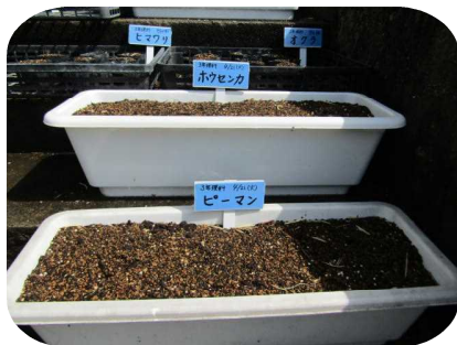
【3年：ピーマン・ヒマワリ他】