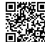
「マグマっ子TV」QRコード

学校の様子を6年生が紹介したり、森リポーターと南方竹太鼓を演奏したりしました。KKBのHPでは、1年間視聴できるそうです。右のQRから入れます。是非、ご視聴ください。