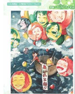
市教委リーフレットより

これからも子供たち一人一人の個性を大切に、子供たちの笑顔であふれる学校づくりに努めてまいります。