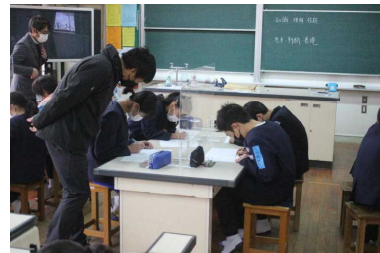
【 交流活動や交流学习の様子 】