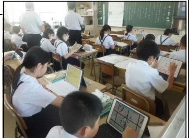
タブレットを使い学習に取り組む子供たち

多くは子供たちや職員の取り組む姿への称賛をいただきましたが、まだまだ努力しないといけないことも多くあると思います。この前始まったと感じる1学期も、もう6月終盤。終業式まで正味1か月となりました。ご指摘いただいたことを含め、常に職員全員で自らの実践を謙虚に見つめ、更に充実した取組を目指していくことにより、子供たちと共にしっかりと1学期の締めくくりをしていきたいと思っています。また、気付かれたこと等ありましたらいつでもご連絡ください。保護者や地域の方々とよりよい宮川小を作っていきたいと思っています。よろしく申し上げます。