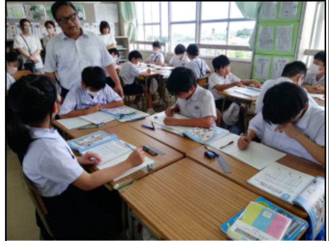
グループ学習に取り組む6年生

この1学期の間、全体としては大きな事故や深刻な生徒指導上のトラブルもなく子供たちが元気に学校生活を送ることができました。これは、職員もちろんですが、保護者や地域の方々が必要な形でサポートしていただいたり、家庭教育の充実に取り組んでいただいたりした賜物と感謝申し上げます。明日から43日間の長い夏休みに入ります。下記のようなことに留意していただいて、楽しく充実した夏休みとなるよう、ご家庭でも声かけや見届けをお願いいたします。