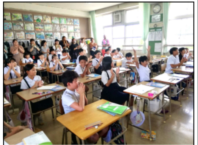
俳句の発表を楽しむ4年生