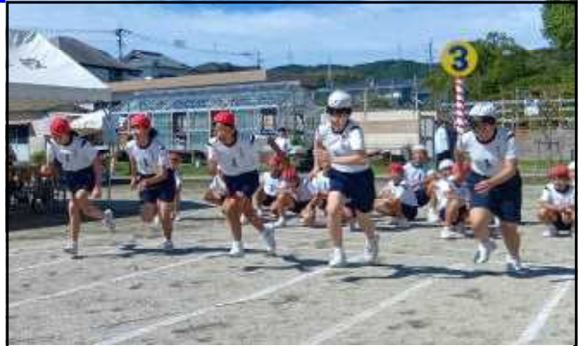
運動会・6年生短距離走

10月6日に実施しました運動会には、たくさんの方々の保護者や地域の方々におこしいただきました。子供たちも、練習の成果を発揮し、全力を尽くすことができましたと思います。「赤も白も一致団結。勝っても負けても称え合う宮川魂」というスローガンを一人一人が体現してくれた運動会だったと思います。これは、当日までの過程を支え励ましていただいたご家庭の力も大きかったと思います。ありがとうございました。さて、先日は運動会に続いて鹿児島市の陸上記録会も行われました。5・6年生の選手児童が参加しましたが、練習の成果を発揮し、それぞれの種目で自分の力を出し切っていました。このように「スポーツの秋」が、真っ盛りというところですが、他にも「芸術の秋」、「食欲の秋」、「読書の秋」等色々な秋があります。先日は、全校朝会で『頑張る5』のことで通して、『言葉』の大切さを子供たちに話しました。実は『頑張る5』のうち4つは、言葉が深くかかわっています。