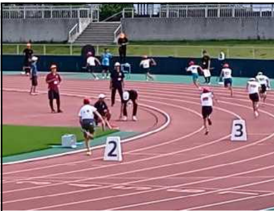
6年男子400mリレーのスタート

このように、『頑張る5』は、言葉を通して豊かな心や言葉の世界を育てようという視点が中核になっています。