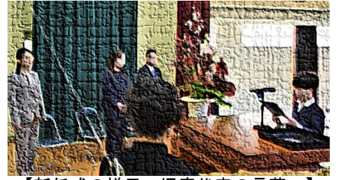
【新任式の様子～児童代表の言葉～】

4月7日(月)、子供たちが元気に登校し、全校児童数95人で令和7年度がスタートしました。まず行われたのは新任式。子供たちは、「どんな先生なのだろう」と自己紹介に聞き入っていました。また、6年生の〇〇〇〇さんは、「宮小あいさつ団があり、あいさつ運動をしたり、あいさつを頑張っている人を紹介したりして、明るいあいさつができるように工夫しています。」と、宮小のよさを交えながら、心を込めて歓迎の言葉を伝えました。