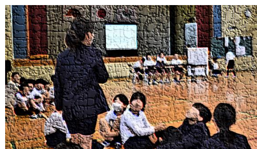
【活発に意見を述べ合う宮っ子】

5月9日(金)に児童総会を行いました。主な内容は、「今年度の宮小合言葉を決めよう」を議題とした話し合い活動。子供たちは活発な意見交換を行いました。学級で話し合ってきた合言葉のよさや必要性を根拠を明確にしながら説明する高学年の子供たち。その発言の仕方にヒントを得て、1年生の子供たちも「なぜなら～」と理由を付けた意見を述べていました。各学級の合言葉がどれも素晴らしかったため、時間内に一つにまとめることはできませんでした。しかし、各学級での話し合い活動の積み重ねが、相手を説得する意見の述べ方や「自分たちの学校は、自分たちの手でよりよくしていこう」という当事者意識の向上につながっていると実感しました。ちなみに、児童総会で出された意見を基に総務委員会で検討した結果、本年度の宮小合言葉は「児童会目標」として、次のように決まりました。95人の力を結集して、この合言葉を実現してほしいものです(児童会目標は、児童玄関ロビーに掲示しています。来校時にご覧ください)。