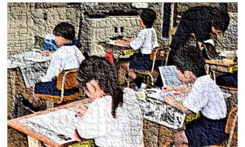
【校内スケッチ大会の様子：2年生】

5月10日(土)に校内スケッチ大会を行いました。事前にタブレットPCで撮影・保存した「絵になる構図」の写真を見ながら遠近の表現に挑戦したり、実際に遊んだ後に、その様子や気持ちを絵に表したりするなど、各学年の目標に応じ、様々な工夫を凝らしていました。描き上げた下絵は、どれも個性的で生き生きとしたものばかり。現在、完成を目指して彩色と仕上げに取り組んでいます。1学期末の学級PTAでは、一人一人の力作をみなさまに紹介できることでしょう。6月25日(水)をお楽しみに。