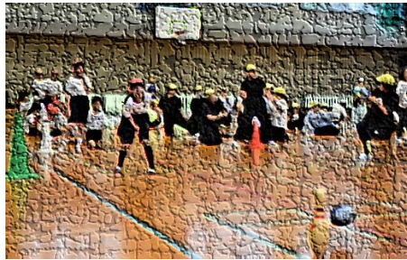
【見事優勝、室内運動会の様子】