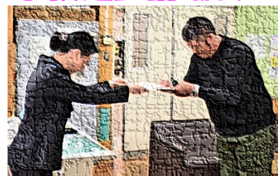
【学校運営協議会の様子(委嘱状交付)】

5月9日(金)に、第1回学校運営協議会が行われました。「学校運営協議会」とは、学校とPTA、地域が学校の運営についての課題や目標を共有し、課題解決のためのアイデアを出し合いながら、対等の立場で「地域とともにある学校づくり」を実現していく仕組みです。委員の方々の主な役割は、 学校経営方針や取組の計画段階からかわりをもつこと 。今回は、令和7年度の学校経営方針について意見を交わし、承認していただきました。