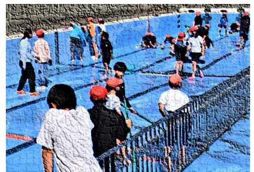
【プール清掃の様子】

なお、本年度の水泳学習の成果は、6月25日(水)の水泳学習発表会で保護者のみなさまに披露します。詳しい日程につきましては、安心安全メール等で配信した学校からの案内や各学級週報でご確認ください。みなさまのご参観を心よりお待ちしております。