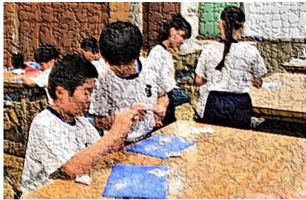
【ペンダントづくりの様子】

5月21日(水)から5月22日(木)の日程で、5年生が集団宿泊学習を行いました。あいにくの空模様のため、県立青少年研修センターに広がる豊かな自然を満喫することは、できませんでした。しかし、16人の仲間と寝食を共にしながら、スギやヒノキの廃材を活用したペンダントづくりや仲間づくりレクリエーション、野外炊飯などの体験活動を通して、普段は気付かない自分のよさや友達のおさに気付くことができました。2日間の貴重な学びをこれからの学校生活に生かしてほしいものです。