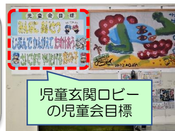
児童玄関ロビーの児童会目標