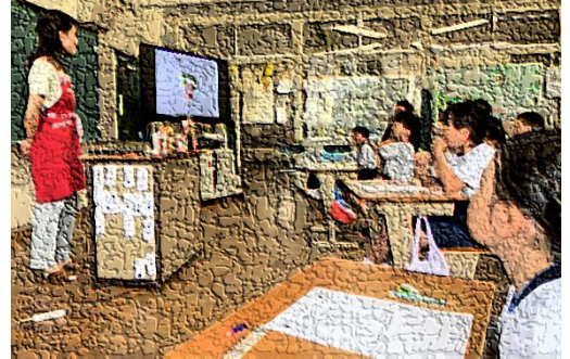
【カゴメ食育教室の様子】

本年度の2年生が生活科で栽培しているミニトマトは、カゴメさんから提供していただいた苗「こあまちゃん」を使っています。栽培活動と関連付けることで、食生活を自分事として捉えられるようになるためです。授業では、「朝食の大切さ」や「トマトを使った料理」について学びました。特に、収穫した「こあまちゃん」を使ってどのような料理ができるかを一緒に考える活動では「トマトを使ったメニューがこんなにあるとは思いませんでした。」と子供たち。食に対する関心を高める貴重な学びの機会となりました。