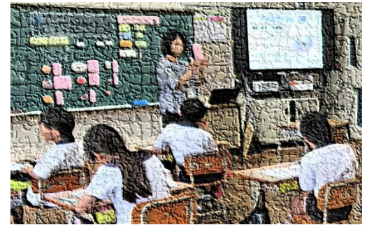
【〇〇先生による食育指導の様子】

「体によいおやつ」とは、三度の食事で摂り切れていない栄養を補う間食のことです。しかし、子供たちが食べているお菓子には、1日の摂取量の目安を大きく超える砂糖や塩分が含まれています。そのことを理解するために、〇〇先生が準備したクイズに取り組みこれからの間食の在り方を考え合いました。