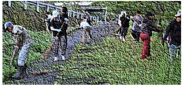
学校、家庭、地域のつながりを象徴する桜通り清掃活動。今回も多くの方が汗を流しました。