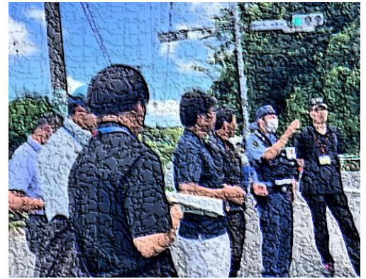
【通学路合同点検の様子】

子供たちの登下校の安全を確保するためには、保護者のみなさまや地域のみなさまからの情報をもとに、関係機関に修繕・改修の要望を上げたりたり、連携して対応策を検討したりすることが大切です。今後とも、通学路の危険箇所に気付いたときには、宮小学校に情報をお寄せください。併せて、各家庭におけるお子さまへの交通安全指導についてもよろしくお願いいたします。