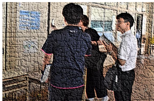
【学校版環境ISO認定校審査の様子】

8月18日(月)、鹿児島市の環境保全課から2人の審査員が来校し、来年度以降も認定校に登録するかどうかを検討する審査が行われました。取組の状況や活動の推進に向けて工夫していることなどを担当の〇〇教諭が説明したあと、審査員と一緒に校内を巡回し、具体的な取組の状況についてチェックを受けました。審査結果は、2学期以降に通知される予定です。来年度以降の3年間も、「学校版環境ISO認定校」に登録されることを願うとともに、本校の活動を更に充実させるため、子供たちと一緒に頑張りたいと決意を新たにすることでした。