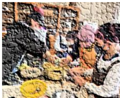
【芋きんちゃく作り(3, 4年生)】