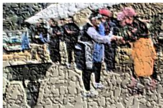
【うるち米の贈呈(収穫祭開会式にて)】

来年度の米作り体験も、学びをつなぎ、生かす場となるように、子供を主体としながら、その内容や方法を工夫しようとする子供たちを支えていきたいと思えます。そのためには、地域のみなさまや保護者のみなさまのお力が必要です。今後とも、宮っ子の学びを広げ、深めるために、御理解と温かい御支援を賜りますよう、よろしくお願いいたします。