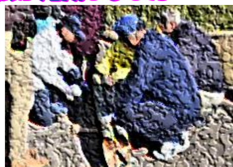
【門松づくりの様子】

おかげさまで、晴れやかな気持ちで新年を迎えられそうです。師走の御多用の中に御尽力くださった校区コミュニティ協議会のみなさま、本当にありがとうございました。