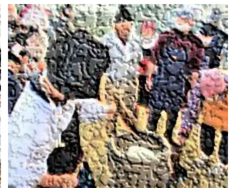
【もちつきの様子(5, 6年生)】