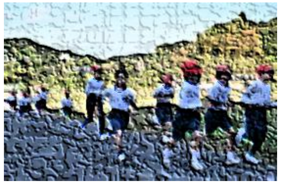
【精一杯走る宮っ子(3, 4年生)】

1, 2年生が1000m, 3, 4年生が1400m, 5, 6年生が1800mの長丁場。目標達成に向けて毎朝の体力づくりに励んできた子供たちは、声援を背に受けながら、走り抜きました。また、完走後は、目標達成の喜びに浸る姿や目標に届かず、悔しがる姿が見られました。結果に喜怒哀楽を感じるのには、精一杯取り組んだ証拠。目標を立て、努力を重ねてきたからこそ味わえる感情です。その喜びや悔しさを次の目標や努力のモチベーションにつなげていくことでしょう。運動会と同様に、「自分で決めた目標→自分なりの努力→本番→過程と結果の振り返り→新たな目標」のサイクルが一人一人の成長につながったと感じた持久走大会でした。次の行事は学習発表会。どんな目標を立てて、発表を創り上げるのでしょうか。今から楽しみです。