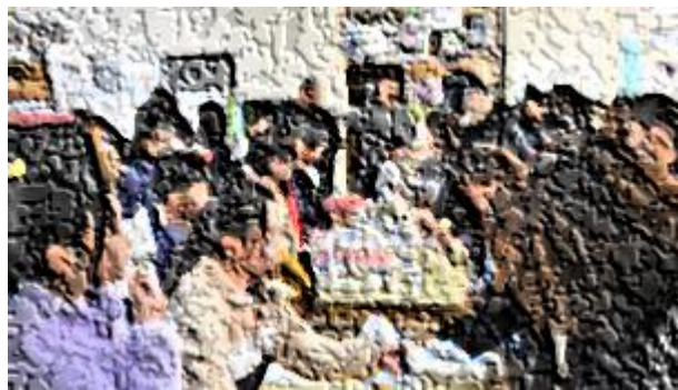
【お米販売の様子(5年生)】

12月3日(水)の学級PTA時に、保護者のみなさまを対象としてお米の販売を行いました。今年度もの子供たちが調べて話し合い、販売価格を設定しました。その価格は、うるち米が1袋400円、もち米が1袋500円。破格の値段に、根拠を尋ねると、「昨年度の価格とのバランスを考えて」、「苗代や精米代、必要経費を収穫量で割った価格から(学習なので儲けは不要)」、「物価高だから、おうちの方には低価格で売りたい」とのこと。また、販売に向けた準備や販売をする中で「並べ方を工夫した方がよい」、「大きな声で宣伝したり、誘導したりしたほうがよい」などのアイデアが生まれました。これらは、3年生の社会で「お店の人のくふう」として学んだことですが、それが、実体験の場で生かされました。そして、「どのように並べれば売れやすいかな」、「どこに立って、誘導すると、買いたい気持ちになるかな」など、工夫の内容を検討・試行することができました。