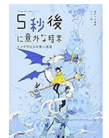
市立図書館読書郵便展出品作品