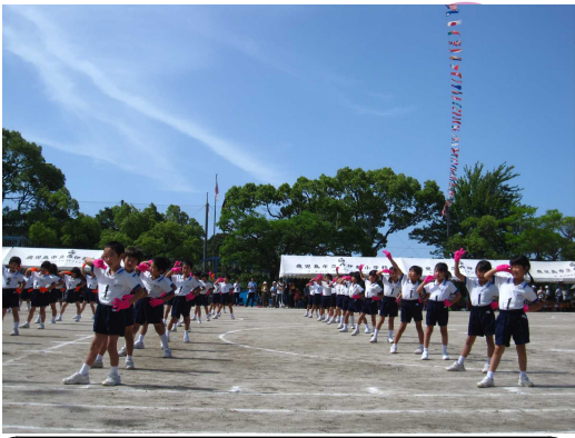
2年：見事な表現力に拍手

当日は、天候にも恵まれ、保護者や地域、学校支援ボランティアの方々の御協力、御支援をいただき、盛会のうちを終了できました。心からお礼申し上げます。