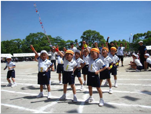
1年：初めての運動会、かわいさいっぱい