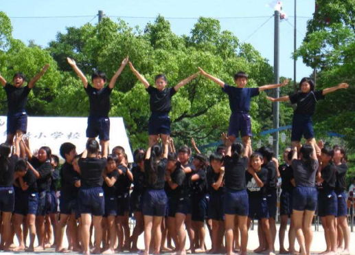
6年：一致団結・最高の演技