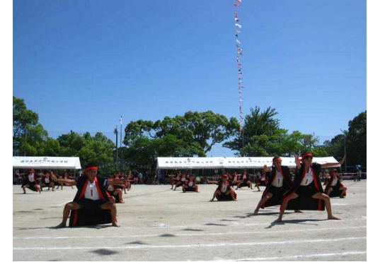
5年：迫力満点のソーラン節