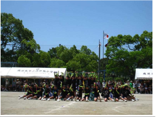
4年：なわとび・一輪車の見事な演技