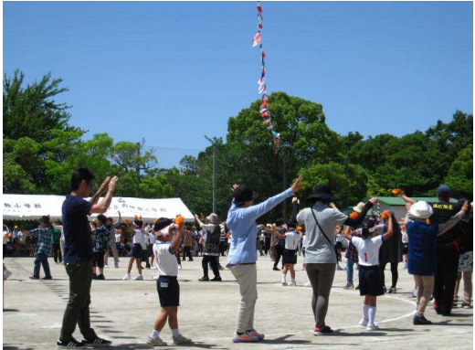
3年：地域と一体となった踊りの披露