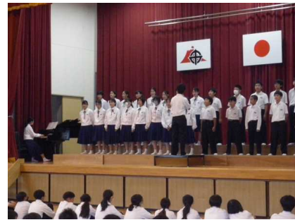
『初めての合唱コンクール 体育館での練習』

さて、先日10月27日(金)に合唱コンクールが行われました。学校運営協議会委員の皆様や保護者の皆様が多数来校され、生徒たちの活動の様子をご覧いただいたことを心より感謝申し上げます。