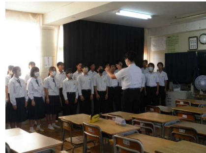
『やり切った合唱コンクール 教室での練習』

どのクラスも練習の成果を発揮し、しっかりと表現することができました。素晴らしいコンクールでした。以下に講師の先生方の好評の一部を紹介します。