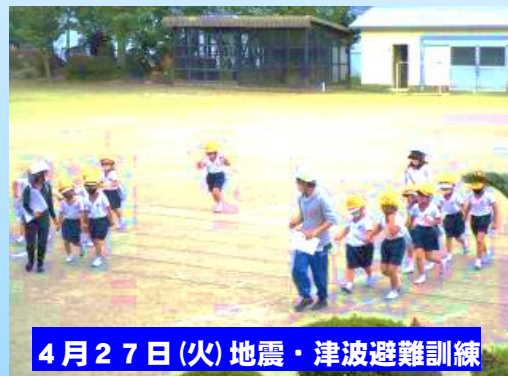
4月27日(火) 地震・津波避難訓練