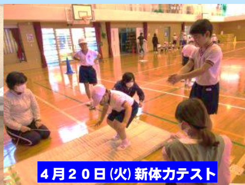
4月20日(火) 新体カテスト