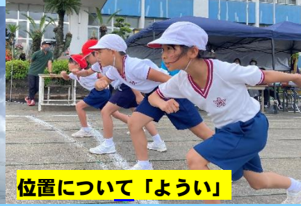
位置について「ようい」