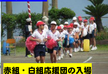
赤組・白組応援団の入場