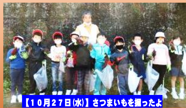
【10月27日(水)】さつまいもを掘ったよ