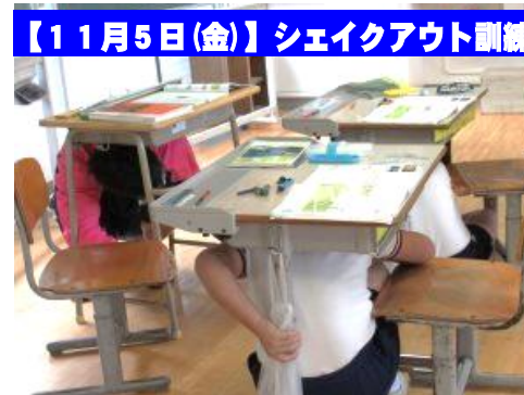
【11月5日(金)】シェイクアウト訓練