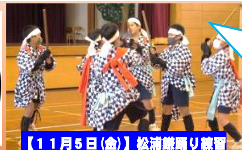
【11月5日(金)】松浦鎌踊り練習

松浦鎌踊り保存会の皆様と一緒に伝統芸能を伝承していきます。勇壮な姿に伝統の重みを感じます。御協力ありがとうございました。