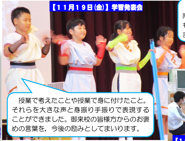
【11月19日(金)】学習発表会

授業で考えたことや授業で身に付けたこと。それらを大きな声と身振り手振りで表現することができました。御来校の皆様方からの褒め言葉を、今後の励みとしてまいります。