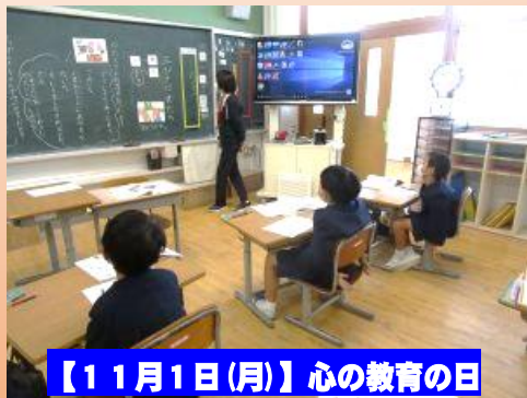
【11月1日(月)】心の教育の日