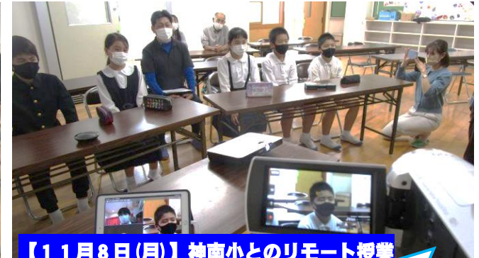
【11月8日(月)】神南小とのリモート授業

授業で考えたことや授業で身に付けたこと。それらを大きな声と身振り手振りで表現することができました。御来校の皆様方からの褒め言葉を、今後の励みとしてまいります。