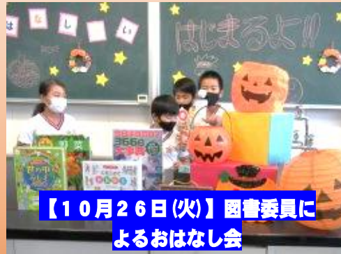
【10月26日(火)】図書委員によるおはなし会