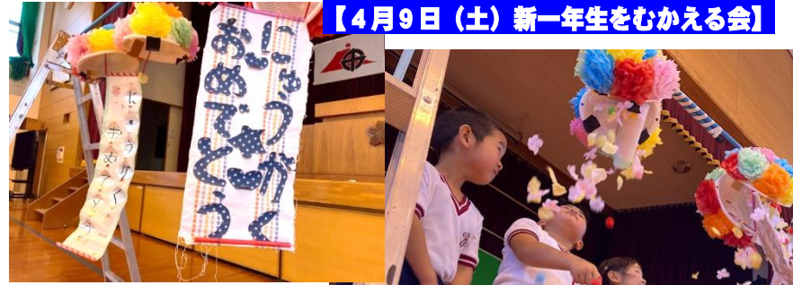
【4月9日(土)新一年生をむかえる会】

もちろん、学校づくりは学校だけでできるものではありません。地域やPTAの皆様のお力添えがなければ成し得ません。学校運営につきまして、これからも一緒に手を取り合っていきたいと思います。どうぞよろしくお願いいたします。