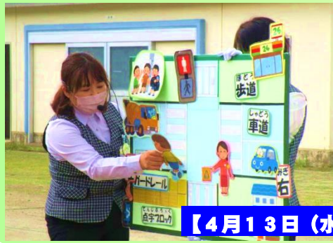
【4月13日(水)交通安全教室】