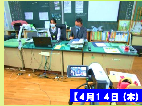
【4月14日(木)～不審者対応訓練～】