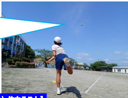
【4月22日(金)体カテスト】

本校では、一校一運動を「ランニング」に設定し、体力作りに励んでいます。写真(右)は「ソフトボール投げ」です。自分の目標と青空に向かって力一杯投げました！