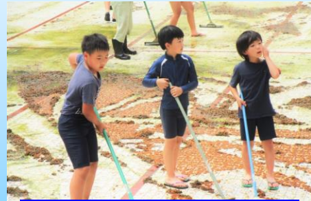
【5月25日(水) プール掃除】