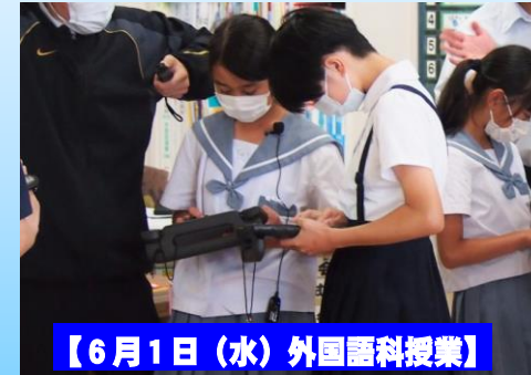
【6月1日(水) 外国語科授業】