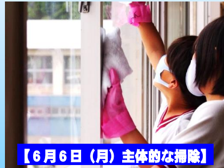
【6月6日(月) 主体的な掃除】