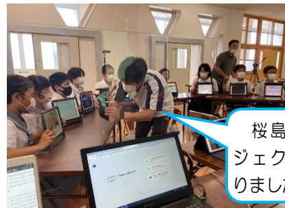
【6月6日(月) 神南小とのリモート授業】

小学生にとって、自分たちが歩んできた十年前の園児、十年先を歩いている大学生から学んだ様々な思いを胸に、未来への道を進んでいく子どもたちへの支援を今後も続けていきたいと考えております。