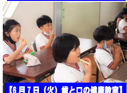
【6月7日(火) 歯と口の健康教室】