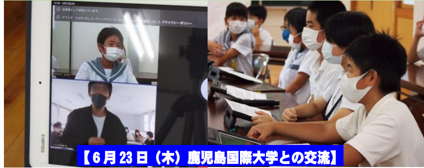
【6月23日(木) 鹿児島国際大学との交流】