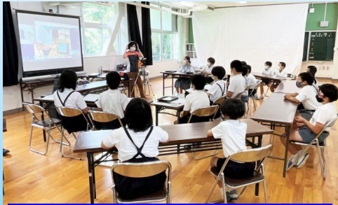
【6月23日(木) 国際大との交流】