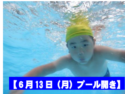
【6月13日(月) プール開き】

児童による児童のための話し合い。テーマは「掃除とiPadの使い方について」建設的な意見がどんどん飛び出しました。