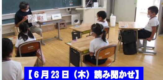
【6月23日(木) 読み聞かせ】

児童による児童のための話し合い。テーマは「掃除とiPadの使い方について」建設的な意見がどんどん飛び出しました。