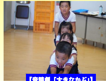
【音読劇「大きなかぶ」】