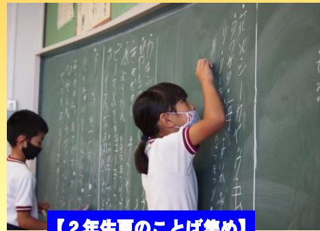
【2年生夏のことば集め】