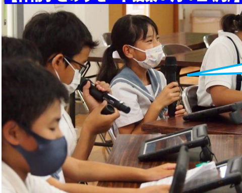
【神南小とのリモート授業7月4日(月)】

どんなに立派な教えでも、やってみなければ自分のためにならないという「日新公いろは歌」の一つです。この夏、お子様の学びの更なる充実を願っております。