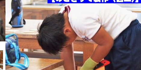
【のこぎりで製作(図工)】

3・4年生の図工は準備万端です。ノコギリを使うときにケガを予防するために作業用手袋を装着！