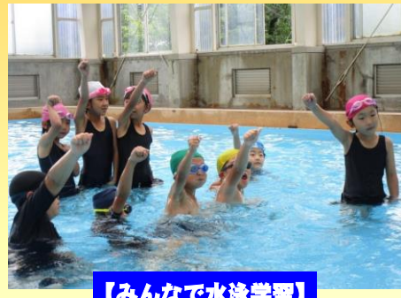
【みんなで水泳学習】