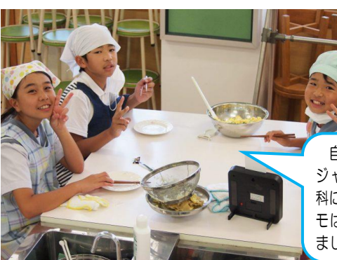
【ポテトサラダを作ってみた(家庭)】

3・4年生の図工は準備万端です。ノコギリを使うときにケガを予防するために作業用手袋を装着！