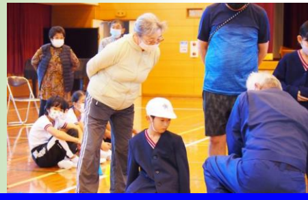
【県民週間(用務主事指導によるポッチャ)】