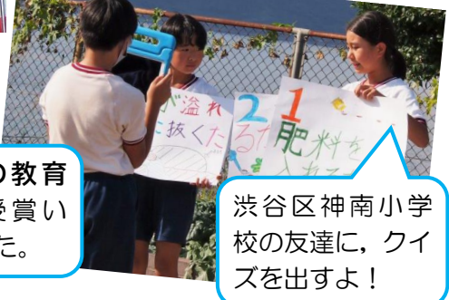
【桜島大根プロジェクトリモート交流】