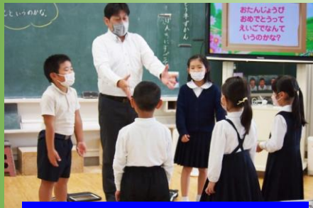
【外国語科研究授業(1・2年生)】