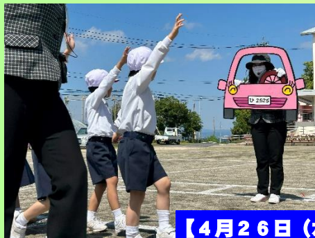
【4月26日(水)交通安全教室】