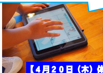
【4月20日(木)体カテスト】

本校では、一校一運動を「ランニング」に設定し、体力作りに励んでいます。記録する道具としてもタブレットが大活躍。