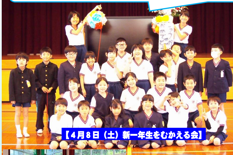
【4月8日(土)新一年生をむかえる会】

名前と好きなものを自己紹介した1年生。総務委員会を中心にジェスチャークイズやくす玉割りも。6人の新入生たちとみんなで大した会となりました。