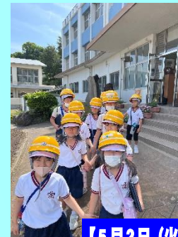
【5月2日(火) 1・2年 校区探検】