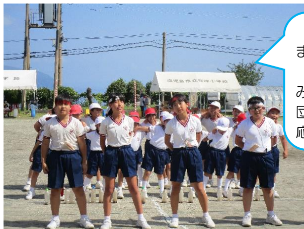
【5月21日(日) 幼・小合同運動会】

今年も晴天に恵まれました。 自発的に肩を組み、学校のみならず、地域のみなさんと団結した凛々しい応援合戦。