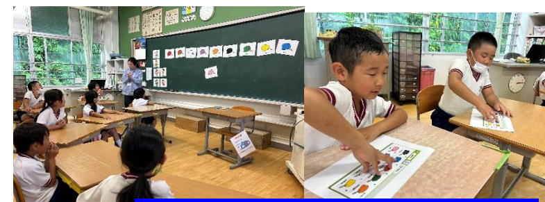
【5月18日(木) 1・2年生 創意 外国語】