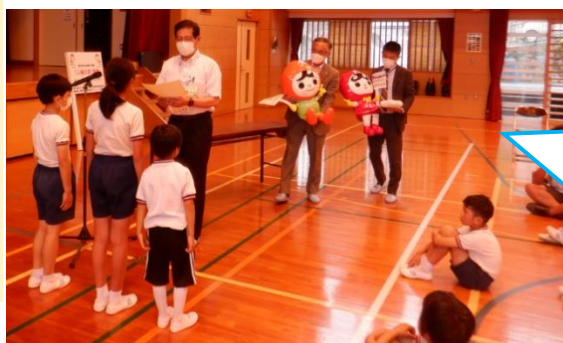
【5月19日(金) 人権の花運動開会式】

人権の大切さについてお話を聞きました。今回いただいた、人権の花である「ひまわり」をみんなで育てます。