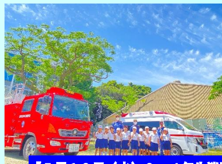
【5月10日(水) 3・4年生消防スケッチ】