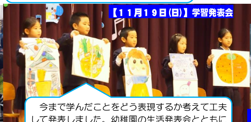
【11月19日(日)】学習発表会

今まで学んだことをどう表現するか考えて工夫して発表しました。幼稚園の生活発表会とともに地域の方に大好評でした。