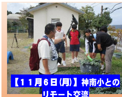
【11月6日(月)】神南小とのリモート交流