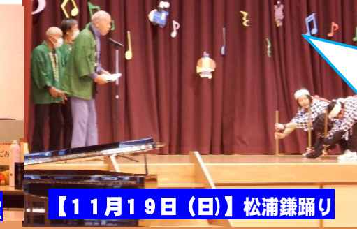
【11月19日(日)】松浦鎌踊り

松浦鎌踊り保存会の皆様と一緒に練習した鎌踊り。荘厳な歌と勇壮な姿に伝統の重みを感じます。御協力ありがとうございました。