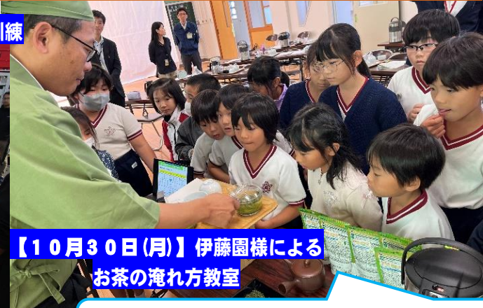
【10月30日(月)】伊藤園様によるお茶の淹れ方教室

地域の方々と一緒に、木を投げて倒した本数や点数をそろえて遊ぶニュースポーツ「モルック」を楽しみました。