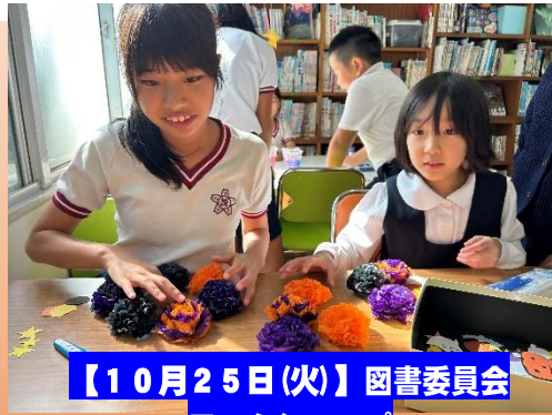
【10月25日(火)】図書委員会ワークショップ