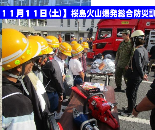
【11月11日(土)】桜島火山爆発総合防災訓練

地域の方々と一緒に、木を投げて倒した本数や点数をそろえて遊ぶニュースポーツ「モルック」を楽しみました。