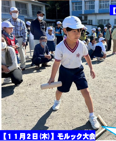
【11月2日(木)】モルック大会

「自律する児童の育成」学校教育目標に向けて学ぶ場は、いろいろなところにあるようです。