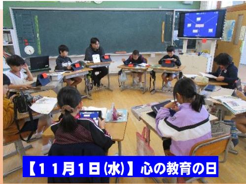
【11月1日(水)】心の教育の日