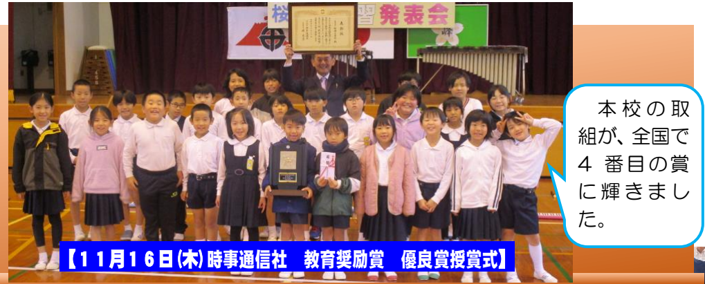
【11月16日(木)】時事通信社 教育奨励賞 優良賞授賞式