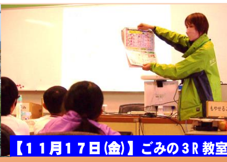
【11月17日(金)】ごみの3R教室