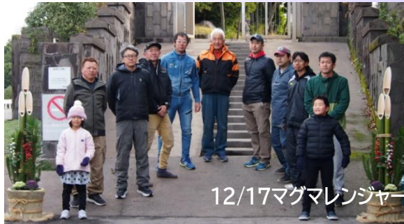
12/17マグマレンジャー門松づくり