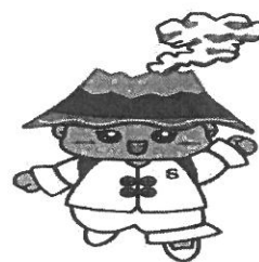
令和元年度制定 坂元台 PTA マスコット キャラクター がんばるせばるちゃん