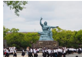
長崎平和記念公園