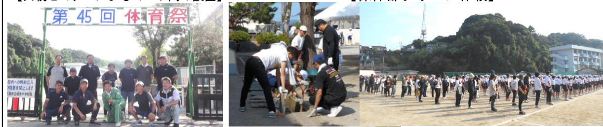
【保体部クリーン作戦】