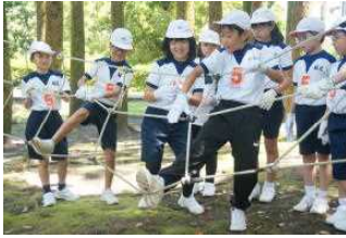
〈グループチャレンジゲーム〉

5月15日(水)～16日(木)の1泊2日で、5年生の集団宿泊学習を実施しました。天候にも恵まれ、予定していた全ての活動を実施することができ、充実した集団宿泊学習となりました。友達と寝食を共にしながら、たくさんのことを学んだ5年生の子どもたち。学んだことを生かしながら、これからの学校生活でも活躍を見せてくれることでしょう。