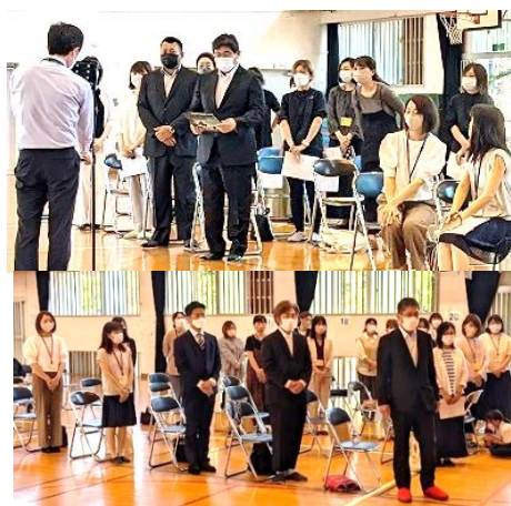
【旧役員(上)新役員(下)の挨拶】