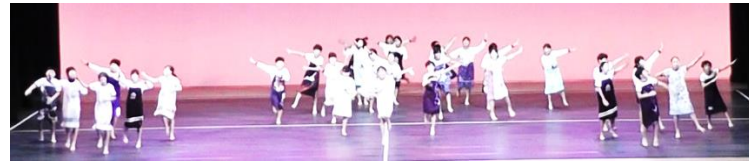
【市表現運動発表会に出場した4年2組(上)と・5年1組(下)】