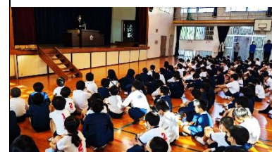
【3年ぶりの体育館での全校朝会】

5月の全校朝会では、3年ぶりに体育館に全校児童集まって行いました。子供たちは並び方などに戸惑っていましたが、対面で、かつ、音響設備も整った環境の中で、校長先生の話を集中して聞いていました。その他、児童総会やいきいきこどもの集い(1年生歓迎会)も体育館で行い、友達や先生と実際に顔を合わせながら参加することができました。