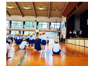
【いきいきこどもの集い】