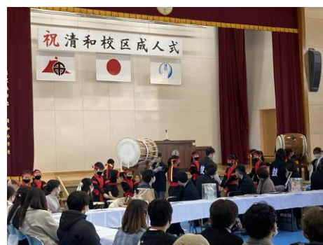
式典のオープニングセレモニーで清和太鼓の皆さんが太鼓の演奏を披露しました。

1月3日(火)に清和校区コミュニティ協議会主催で、「20歳を祝う会」が実施されました。今年度は平成26年度卒業生が対象で、当日は当時の校長先生、担任の先生方を含め約100名が集まり、盛大に行われました。久しぶりの友達との懐かしい再会などに盛り上がり、近況報告をしたり、8年ぶりに6年生時の教室でタイムカプセルを開けて思い出を語り合ったりしていました。清和小学校での思い出や経験を生かして、それぞれの道で頑張してほしいものです。