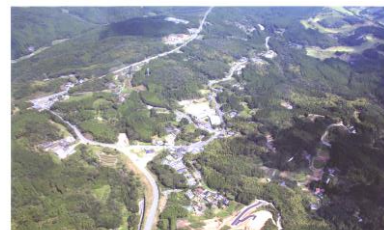
高度500mからの校区の全景