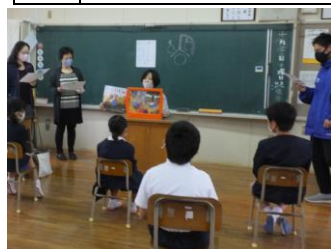
4月 小・中合同読み聞かせ