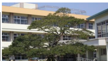
シンボルツリー「なかよしの木」 (クロガネモチ) 子どもたちは木登りをして遊ぶ