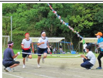
9月 小・中・校区合同大運動会