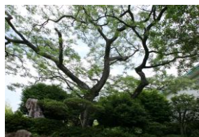
市保存樹「センダン」の木