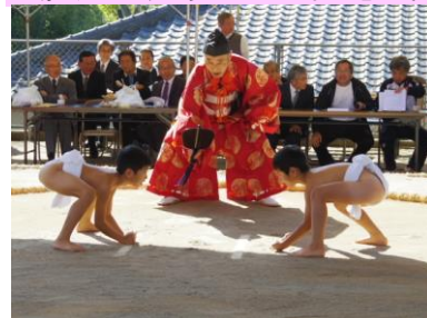
第363回を数える錫山相撲