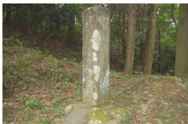
錫鉱山発見の地記念碑