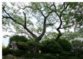
市保存樹「センダン」の木