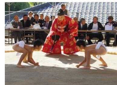
第366回を数える錫山相撲