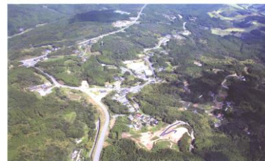
高度500mからの校区の全景