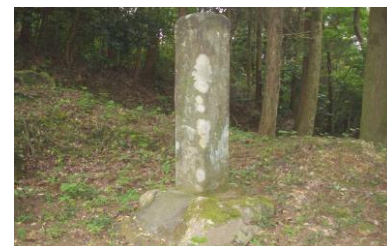
錫鉱山発見の地記念碑