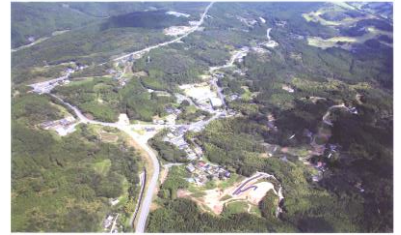
高度500mからの校区の全景