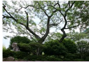
市保存樹「センダン」の木