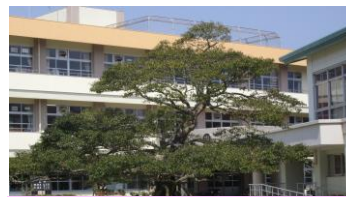
シンボルツリー「なかよしの木」 (クロガネモチ) 子どもたちは木登りをして遊ぶ