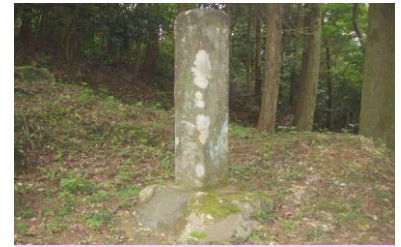
錫鉱山発見の地記念碑