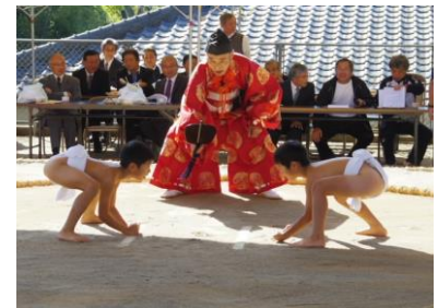
第367回を数える錫山相撲