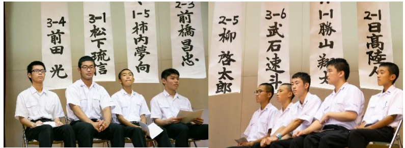
発表した9名の弁士