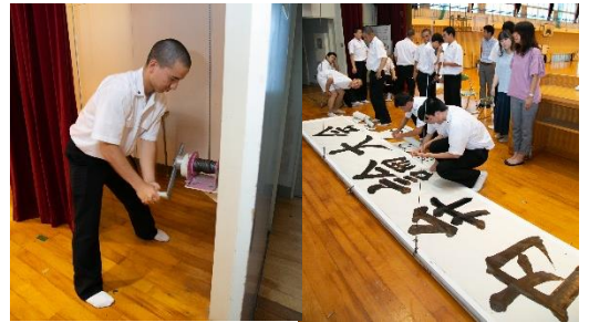
生徒会役員や学芸員、放送部の準備の様子