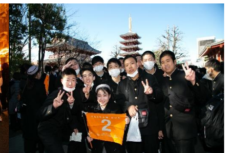
お世話になったバスガイドさんと