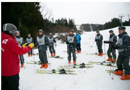
初めてのスキーにワクワク

1月28日(火)の早朝に学校を出発し、3泊4日の関東方面への修学旅行が実施されました。初日と2日目はスキー教室に参加し、初めてスキーを経験する生徒がほとんどでしたが、インストラクターの指導を受けて上手に滑ることが出来たようです。3日目は東京ディズニーリゾート、4日目は浅草寺とお台場を散策し、楽しい旅の思い出やお土産をたくさん抱えて鹿児島へ帰ってきました。