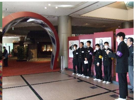
笑顔でお客様を迎えます