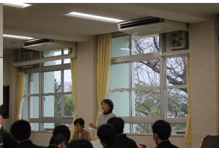
講師の先生方のアドバイス