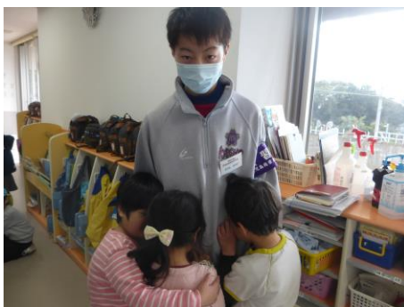
優しいお兄ちゃん

1月28日～1月31日の4日間、1年生のインターンシップが実施されました。この学習は、生徒が各企業や事業所・飲食店などの職場で実際に働くことによって、勤労観の育成を目指し将来の積極的な進路選択に生かすことを目的としています。本年度も多くの企業や事業所で生徒を受け入れていただき、普段の学校生活では経験することの出来ない貴重な体験を通して、生徒は「働くことの意義」や「マナーや挨拶の大切さ」について学ぶことが出来ました。