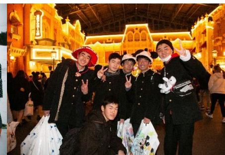
夢の国での楽しい時間