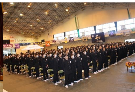
高校生活最後の校歌・錦江湾頭