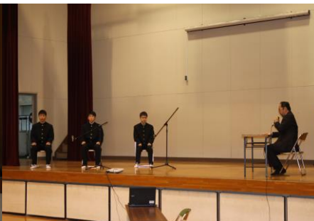
緊張感のある模擬面接