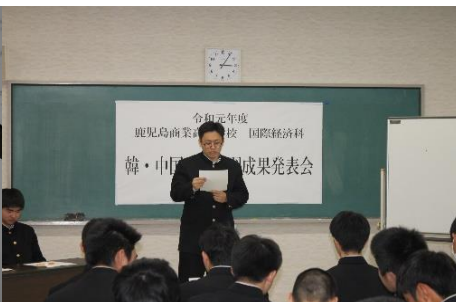
流暢な韓国語を披露