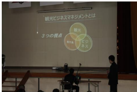
課題研究「調査研究」についての発表

2月5日(水)に3年生による課題研究発表会が行われました。1年間の「課題研究」の授業で研究した内容について各グループでパワーポイントを使い、1・2年生にも分かりやすく説明していました。特に2年生にとっては来年度から取り組む課題研究の参考になったようです。また、2月12日(水)には進路が決定した3年生が、進学・就職・公務員それぞれの立場から進路実現に向けてどのように取り組んだかを実体験を交えながら話してくれました。模擬面接やパネルディスカッションもあり、1・2年生は熱心に聞き入っていました。