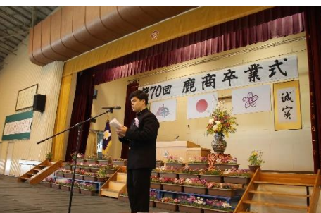
卒業生代表による答辞