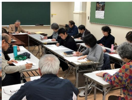
真剣な表情で会議に参加中