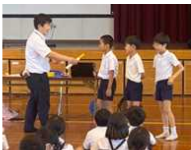
【4年生での学習の様子】