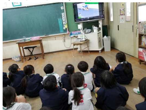
【DVD視聴中の児童の様子】

12月20日(木)1時間目に、命について考える安全学習を全児童で行いました。始めに校長先生の命の大切さの話に真剣な眼差しで耳を傾けました。次に安全指導担当の先生から、横断補導の渡り方や横断歩道のない場所の渡り方等について指導を受けました。その後、教室に戻り交通安全に関する危険予測のDVDを視聴しました。大切な命です。自分自身で守れるように危険予測能力を身につけられるようにしていきたいです。