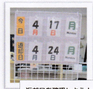
返却日を確認しよう！