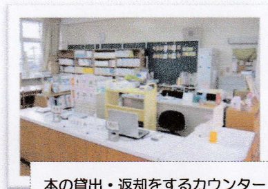
本の貸出・返却をするカウンター