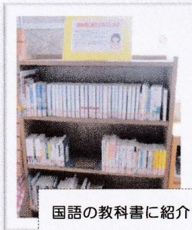
国語の教科書に紹介されて いる本のコーナーです。