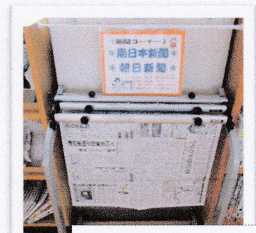
時には新聞を読んでみて。

*図書委員のおすすめの本* 今回は、新1年生におすすめする 本を紹介しています。