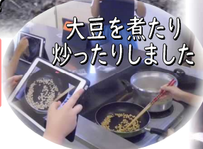
大豆を煮たり炒ったりしました