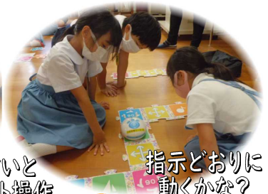
すいすいと タブレット操作