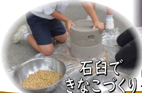
石臼できなこづくり

3年生が国語「すがたをかえる大豆」の学習で、実際に大豆を煮たり、炒った後に石臼でこなにひいたりしました。その様子をタブレットを使って写真や動画で記録し、まとめて活用しました。