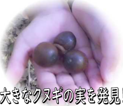
大きなクヌギの実を発見!