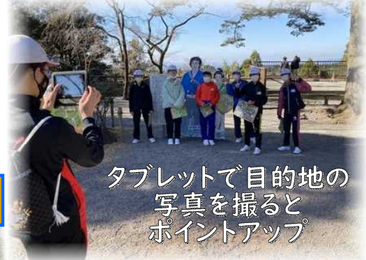
タブレットで目的地の写真を撮るとポイントアップ

12月18日(土)に、今年度も「根っここの会」の皆様のご協力により立派な門松を作ることができました。見事なチームワークで手際よく作業が進められていました。縄の結び方にも決まりがあって、簡単にはできないことを知りました。ありがとうございました。