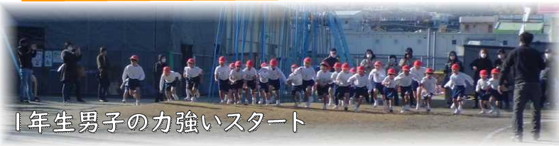
1年生男子の力強いスタート

12月1日(水)4・6年生, 2日(木)3・5年生, 3日(金)1・2年生の校内持久走大会が実施されました。これまで体育の時間や朝の持久走練習の時間などで練習に励んできた成果を発揮し、友達や応援に来てくださった保護者の皆様の励ましの言葉を力にして最後まで走りぬくことができました。